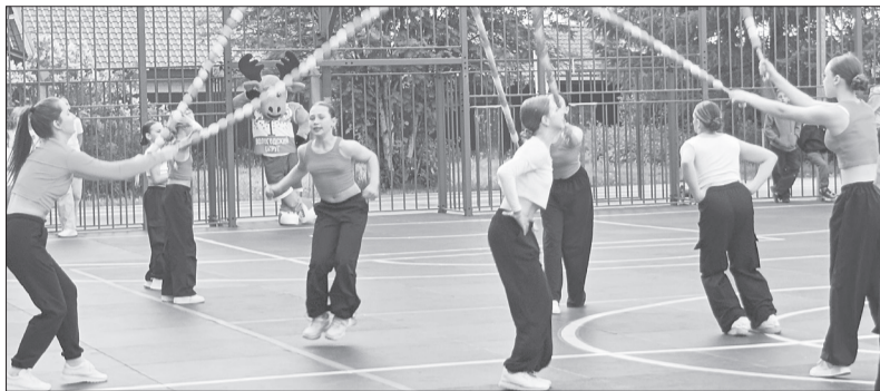
Шоу-группа «Энергия» из Майского приняла участие в открытии спортплощадки

Многофункциональная площадка рассчитана на занятия людей всех возрастов и разных уровней спортивной подготовки. Она включает в себя спортивное поле для занятий тремя игровыми видами спорта: футбол, волейбол, баскетбол; воркаут-комплекс и силовые тренажеры. Именно эта площадка оснащена дополнительным инклюзивным оборудованием, которое позволит заниматься людям с ограниченными возможностями