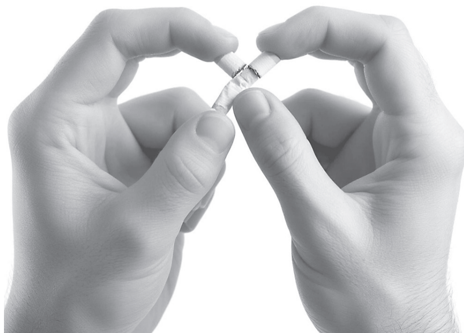
Сделай первый шаг к своему здоровью — откажись от курения!

Долгосрочный эффект еще более впечатляет. Через 10 лет шансы заболеть