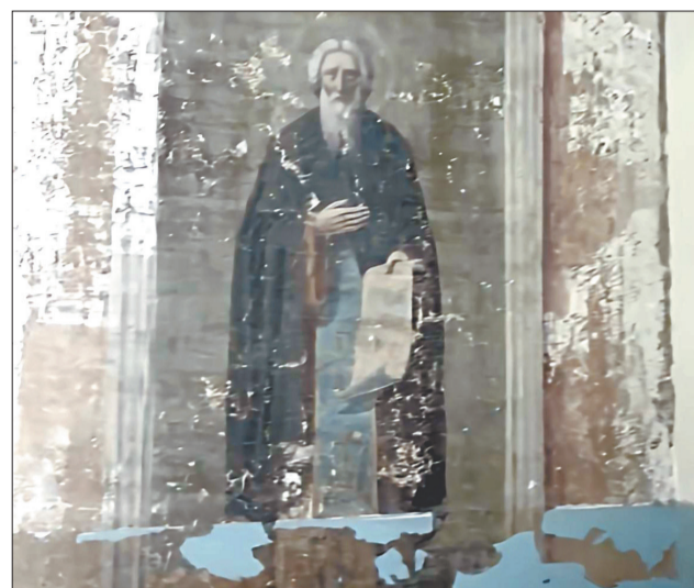
После аккуратного удаления верхних слоёв на стенах библиотеки открылась фигура святого Дмитрия Прилуцкого — значимый исторический и духовный образ