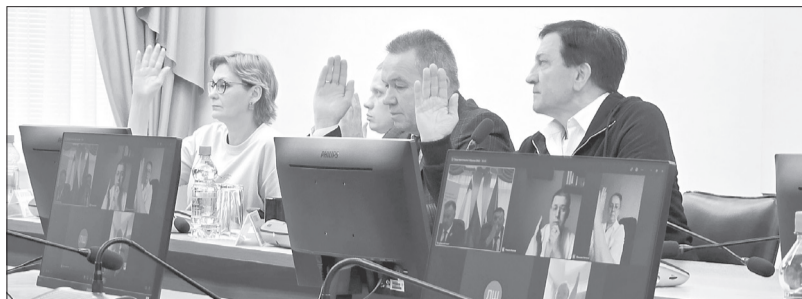
Депутаты Представительного собрания одобрили поправки в бюджет округа

Депутаты Представительного собрания рассмотрели очередные изменения в бюджет Вологодского округа на 2026 год. Основная причина — перераспределение межбюджетных трансфертов.