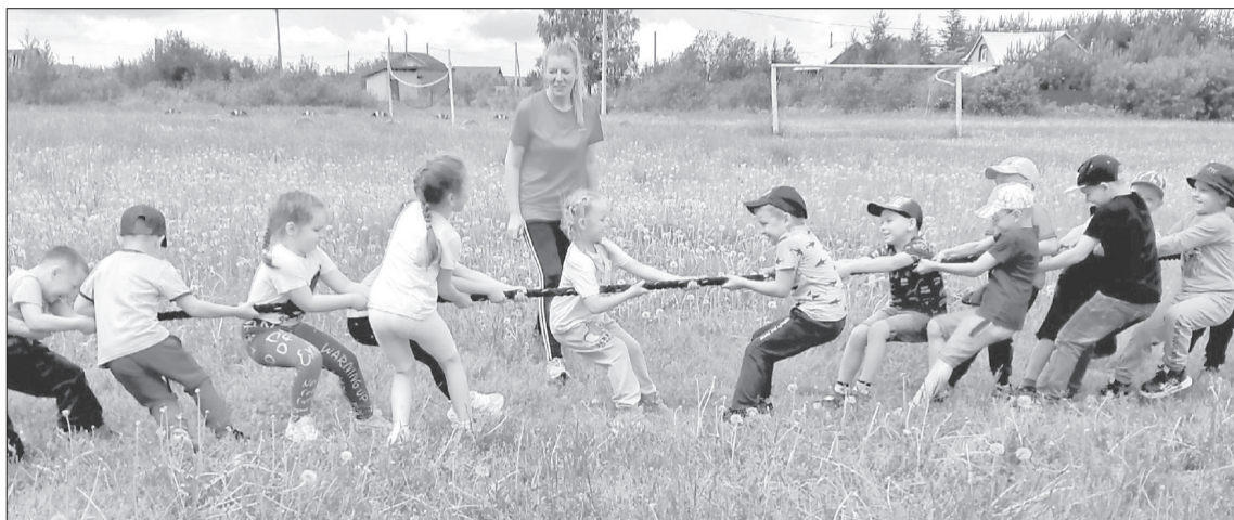
В Вологодском округе этим летом работает 28 лагерей дневного пребывания

Более 300 подростков от 14 до 18 лет будут трудоустроены этим