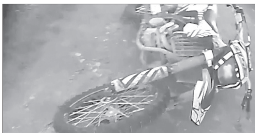
Питбайки, скутеры, мотоциклы хоть и считаются маломощными, но это серьезный транспорт, требующий навыков вождения и знания Правил дорожного движения