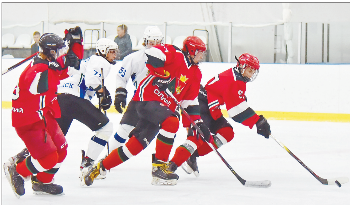
«Триумф — результат невероятного упорства, мастерства и слаженной командной работы. Так держать!» — пишут в соцсетях болельщики матча

«Олимп» начал с мощного старта, победив «Раменское» и «Приморье» со счетом 4:2 в каждом матче. Каждый гол был результатом слаженной работы команды, где каждый игрок вносил свой вклад. Но ключевой момент наступил в финальном противостоянии с «Алмазом».