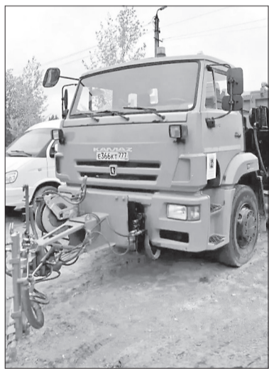
В муниципалитеты Вологодчины доставили спецтехнику из Москвы

Техника передана столицей на безвозмездной основе. Получателем стал и Вологодский округ, в который доставили две специализированные машины — универсальную машину на базе КамАЗа и фронтальный погрузчик.