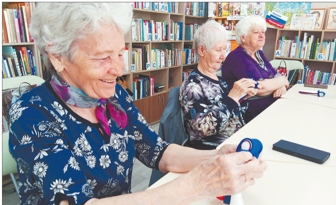
Библиотеки из тихих хранилищ знаний превращаются в места для общения, творчества и саморазвития

или Как преобразуются библиотеки Вологодского округа