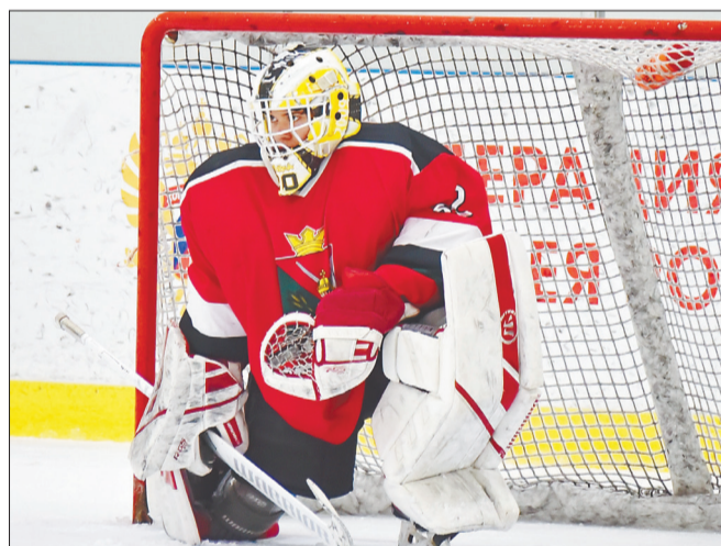
«Трус не играет в хоккей». Известную песню про хоккеистов Александра Пахмутова написала в 1972 г. по случаю финала «Золотой шайбы»

Башкирская команда, несмотря на сопротивление, выиграла со счетом 5:3, оставив вологжанам серебро. В напряженной борьбе олимповцы показали высокий уровень мастерства, умения адаптироваться к изменениям в игре и сохранять концентрацию даже в критический момент.