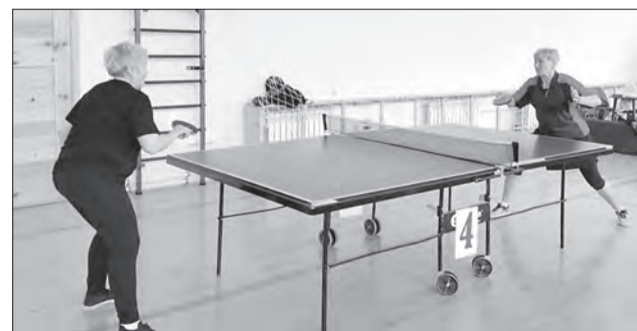
Очень упорными выдалась поединки между представительницами прекрасного пола