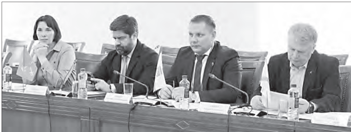
Участники заседания Комитета по агропромышленному комплексу и продовольствию ПАСЗР предлагают Правительству РФ рассмотреть возможность возврата к порядку предоставления субсидий, действовавшему до 1 января 2026 года

Согласно новым правилам, софинансирование из центра на килограмм произведенного молока отныне доступно исключительно малым предприятиям с годовым доходом до 800 млн рублей. В результате наиболее технологичные и производительные хозяйства регионов Северо-Запада фактически лишились ключевого вида господдержки. По данным парламентариев, суммарные потери бюджетов субъектов СЗФО уже превысили