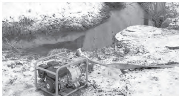
Жителям Соснового Берега в пик паводка пришлось установить мотопомпы для откачки воды из канав

Теплая и ранняя весна в этом году спровоцировала более раннее вскрытие рек ото льда и интенсивное таяние снега.