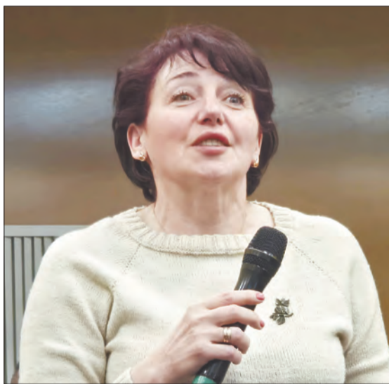
Основная масса вопросов от жителей касалась тем дорог, уличного освещения, водоснабжения