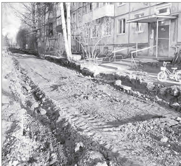
По контракту работы должны быть завершены до 1 августа

Всего на благоустройство дворов в Вологодской области направят 476,1 миллиона рублей. Финансирование выделено из консолидированного бюджета: