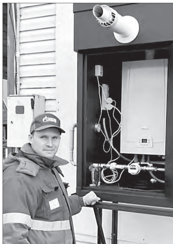
22 домовладения в деревне Пески могут подключиться к газу

Специалисты «Газпром газораспределение Вологда» ввели в эксплуатацию межпоселковый распределительный газопровод протяженностью 2,4 км и смонтировали пункт редуцирования газа в деревне Пески Новленского территориального управления. Благодаря этому появилась техническая возможность газификации 22 домовладений. В настоящий момент заключено девять договоров с жителями деревни на догазификацию.