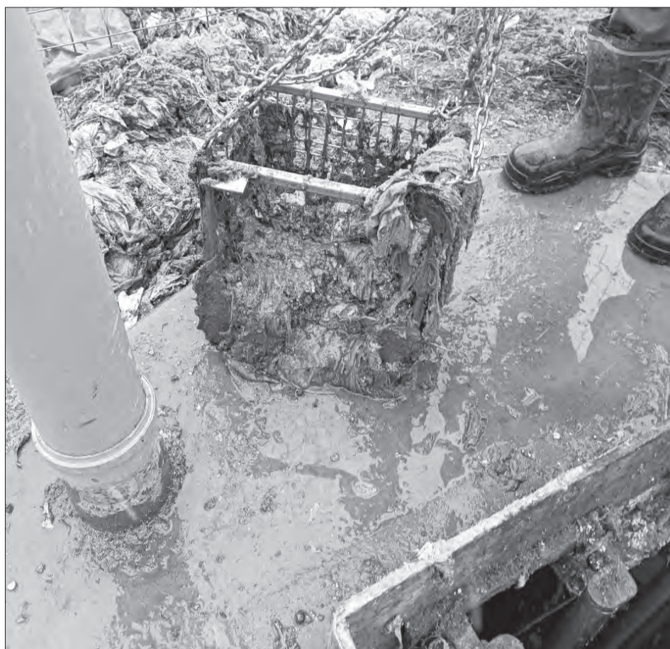
«Улов» сантехников: корзины-уловители на канализационно-насосной станции в Маурине, забитые спускаемым в канализацию «добром»

Запомните: в унитаз можно смывать только продукты жизнедеятельности человека и туалетную бумагу (обычную, не влажную). Всё. Список закончен. Но раз люди продолжают экспериментировать, поясним подробнее.