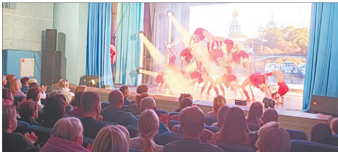
В репертуаре цирковой студии «Энергия» несколько десятков ярких зрелищных номеров разной сложности исполнения. С коллективом работают два профессиональных тренера и хореограф, вкладывая в развитие юных дарований свои сердце и душу

Родители, поддерживая увлечение детей цирковым искусством и воздушной гимна-