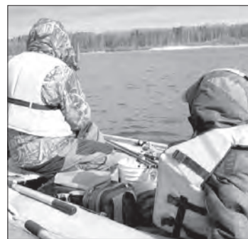
МЧС призывает жителей и гостей региона соблюдать правила пользования водными объектами и воздержаться от пользования маломерным судном до даты открытия навигации

На неделю позднее — с 25 апреля — откроется на-