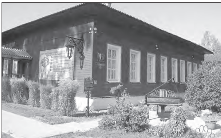
По «Народному бюджету» вокруг краеведческого музея в Кубенском установят ограждение