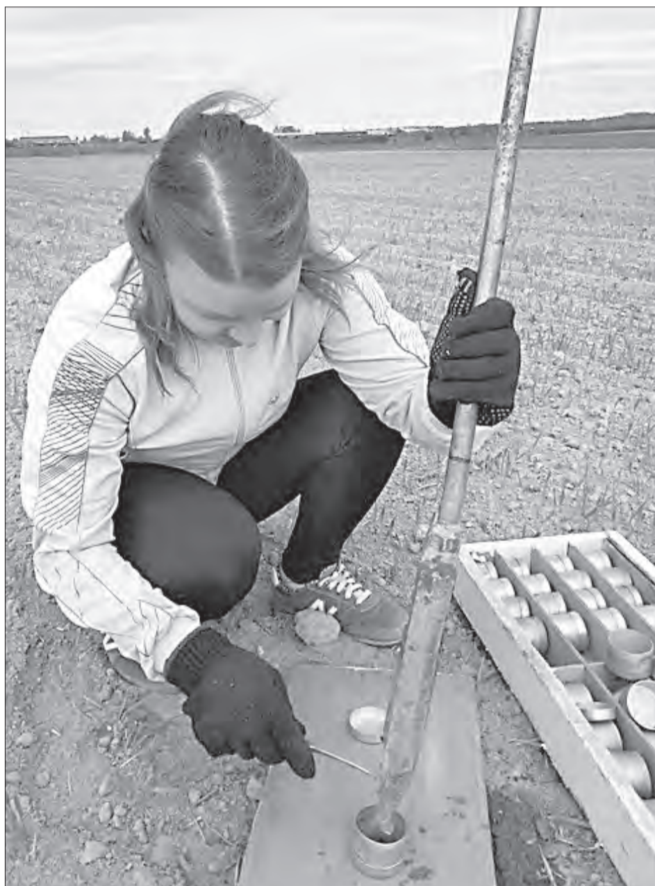
Агрометеорологи, работая на станции, расположенной в Семёнкове-2, постоянно делают замеры на полях СХПК «Присухонское» и «Агрофирмы Красная Звезда». На основе полученных данных делается агропрогноз

Для вологодских аграриев это уже не просто прогноз — это инструмент управ-