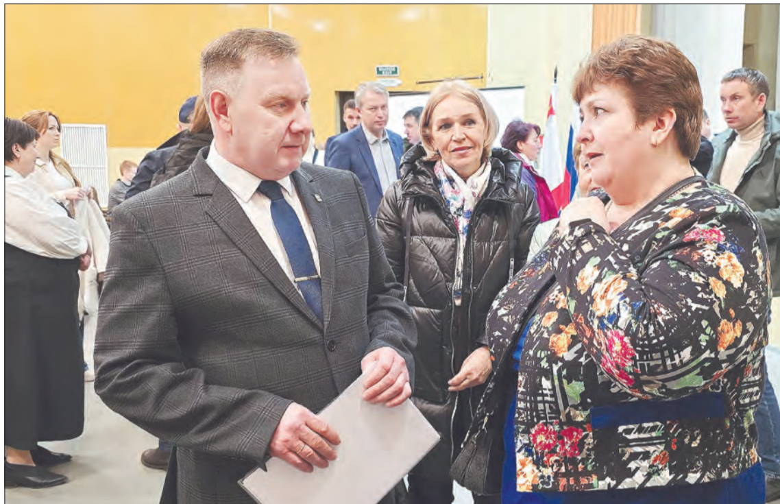
Все вопросы, поступившие от жителей, взяты в работу

На мероприятии глава познакомил собравшихся с кандида-