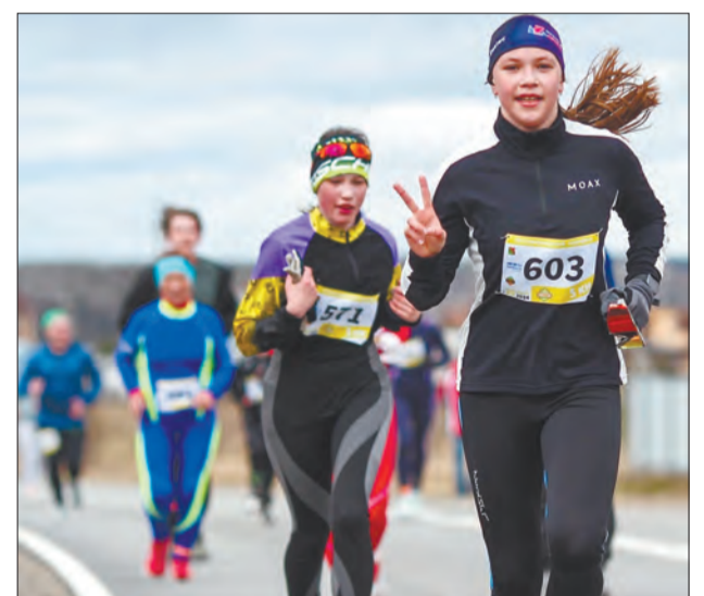
Стризневский марафон открывает летний легкоатлетический сезон

В прошлом году честь Вологодского округа защищали 52 спортсмена из Фетинина, Алексина, Фофанцева, Сосновки, Харачева, Родионцева, Ермакова, Уткина, Кипелова, Майского, Кувшинова, Федотова, Васильевского и других населенных пунктов. По итогам прошлого года Вологодский округ стал лидером по числу участников.