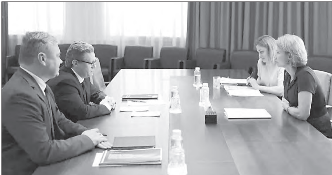
Губернатор Георгий Филимонов поблагодарил министра за продуктивный разговор, поддержку АПК и высокую оценку

«Объем производства молока вырос на 4,7 % — до 695,8 тыс. тонн. Это рекорд с 1991 года. По надоям на душу населения мы занимаем первое место в Северо-Западном федеральном округе и шестое — в России. Еще один исторический максимум: продуктивность коров достигла 9482 кг молока на одну