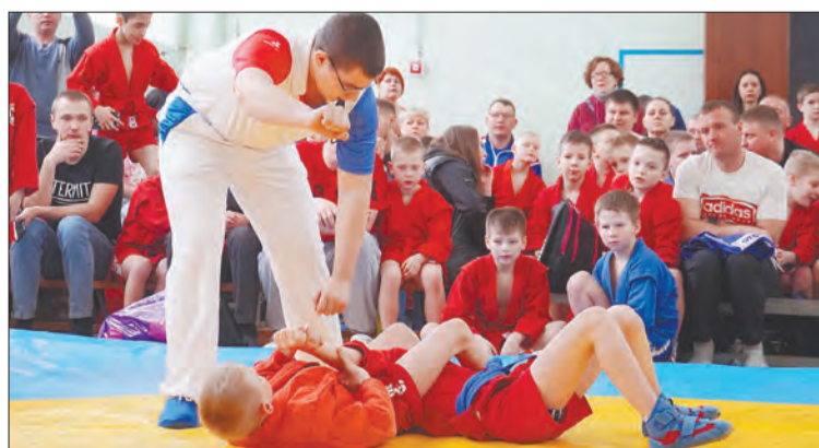
Основные принципы самбо — техника контроля противника, использование его силы против него самого и максимальная эффективность приёмов при минимуме усилий

В этот день в Майской школе шумно и по-спортивному жарко от переживаний и возгласов поддержки. Школьный спортзал полон: на скамейках и у кромки ковра нет ни одного свободного места. На ковре — в основном ученики начальных классов. У них пока нет ни званий, ни поясов. Возможно, именно эти соревнования станут для ребят первой ступенькой в большой спорт.