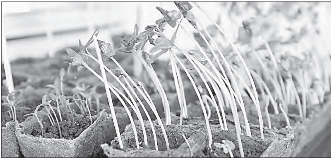
Вытягивание рассады — это избыточный рост стеблей, защитная реакция растений на неблагоприятные условия. Когда что-то идёт не так, растение начинает активно тянуться вверх, жертвуя толщиной стебля

Что делать, если рассада вытянулась вверх, а до высадки в грунт ещё далеко?