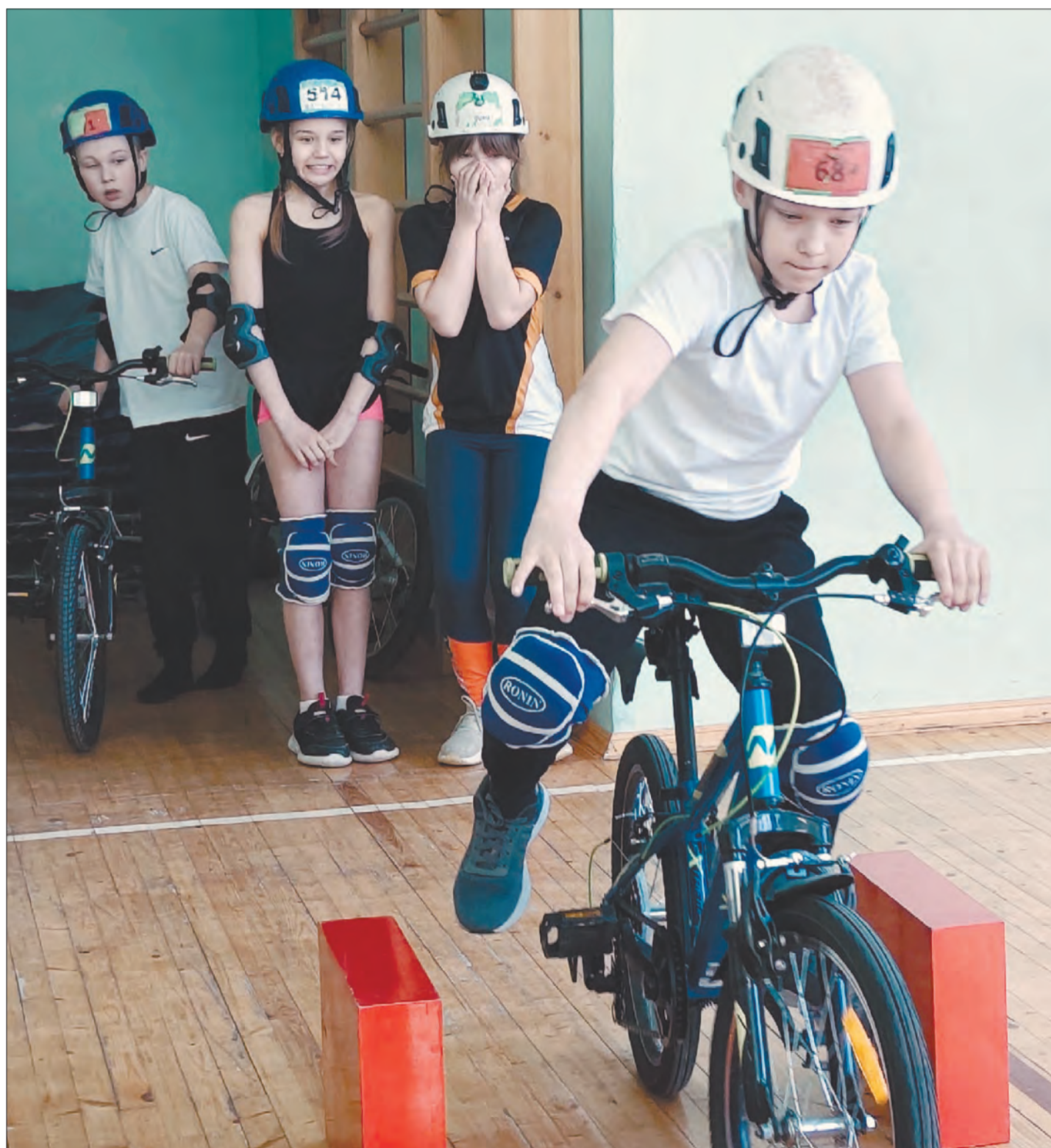
Участники конкурса признаются, что преодолеть полосу препятствий на велосипеде было очень сложно