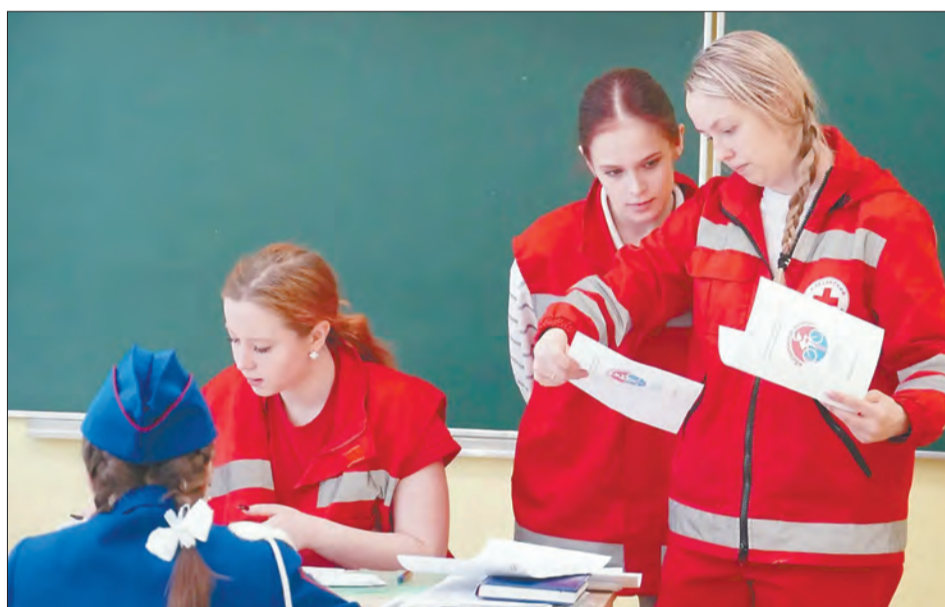
Оказание первой помощи — важнейший этап, проверяли и знание теории, и практические умения

«У нас в учебные дни вся площадь перед школой заставлена и велосипедами, и электросамокатами — больше сотни.