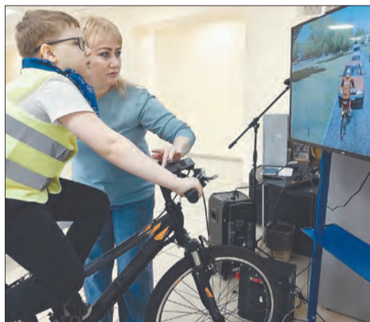
Тренировки на велотренажёре помогут на отлично пройти по дистанции фигурного веловождения