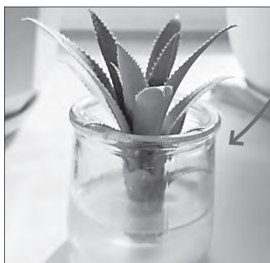
Верхушка ананаса называется «султан» — из неё реально вырастить новое растение