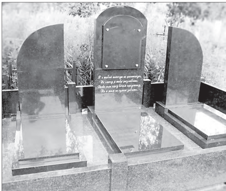
Максимальная площадь семейного захоронения не может превышать 12 кв. м

Участок предоставляется бесплатно на любом открытом общественном кладбище округа. Решение принимает территориальное управление администрации на основании заявления гражданина. На каждое зарегистрированное семейное захоронение заводится именное