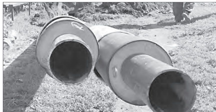
Обновление наружных сетей позволит повысить надежность теплоснабжения для 736 жителей поселка