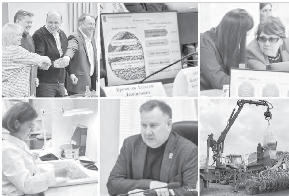
Готовность предприятий округа к посевной обсудили в администрации муниципалитета

Семенами предприятия обеспечены практически на 100 %, причём 40 % из них — семена высших репродукций, элита и суперэлита. В рамках сортообновления завезены 147 тонн семян, из которых 129 тонн — многолетние травы. Также закуплены семена кукурузы, рапса и семенной картофель.