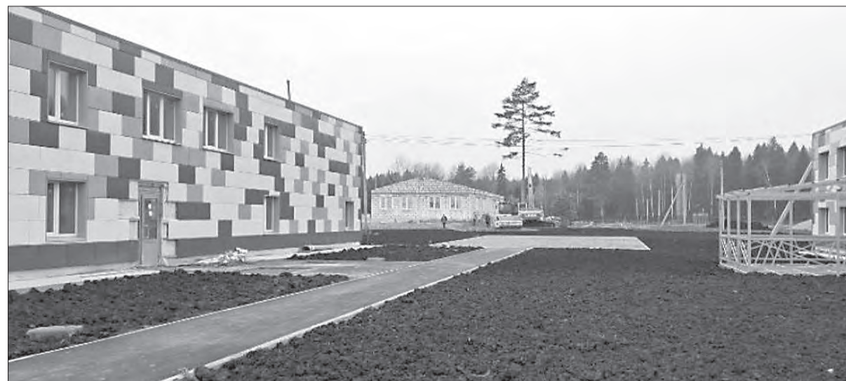
Теперь лагерь «Дружба» сможет принимать детей круглый год

В Вологодской области полным ходом идет подготовка к летней оздоровительной кампании. Один из ключевых объектов — детский лагерь «Дружба» на реке Комёле в Вологодском округе, где сейчас завершается реконструкция. Как только работы закончатся, этим летом здесь смогут отдохнуть порядка 1800 ребят.