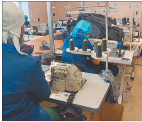
Каждая швея получает стабильный заработок, который затем может потратить по своему усмотрению