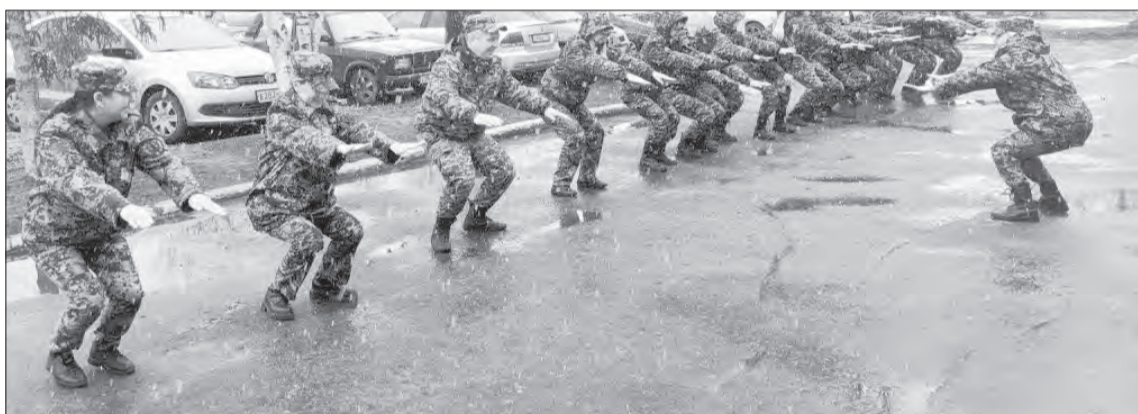
К акции присоединились и сотрудники ИК-2 в деревне Княгинино. В День здоровья они провели зарядку и успешно выполнили норматив по количеству шагов

пенсионеров бодрую зарядку. После разминки дружная компания отправилась покорять дистанцию в 10 тысяч шагов.