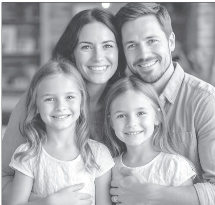
Семья — это фундамент общества, основа его будущего и главная ценность, которая требует постоянной заботы и защиты

Серьезным подспорьем стали новые единовременные выплаты для родителей. В 2026 году при рождении первенца 109 молодых мам в возрасте до 25 лет получили по 100 тысяч рублей. Кроме того, 40 моло-