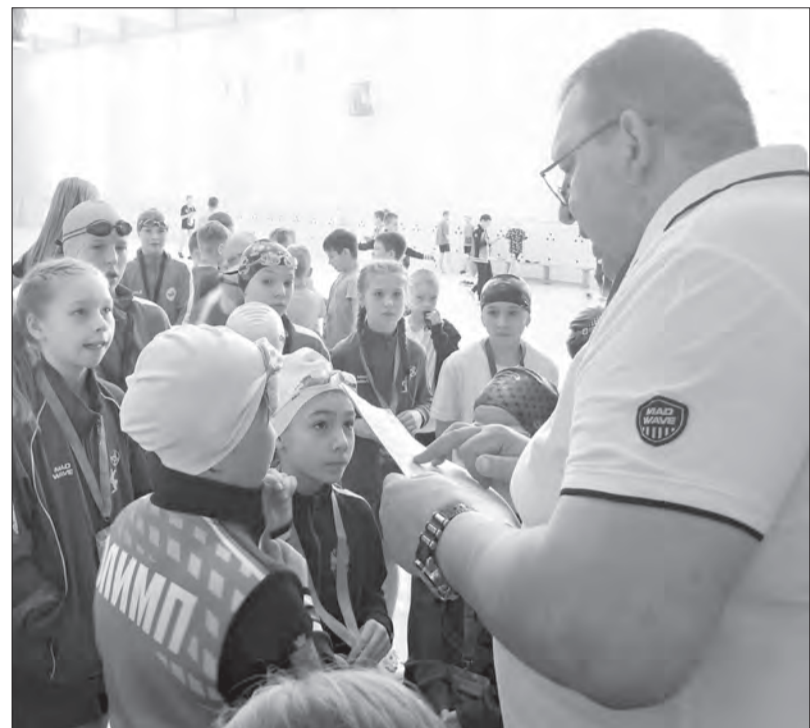
По итогам первого этапа пловцы спортивной школы «Олимп» заняли первые места в каждой возрастной группе

В Майском стартовало межмуниципальное первенство по плаванию «Звезда Афашины», которое в этом году состоит из четырех этапов