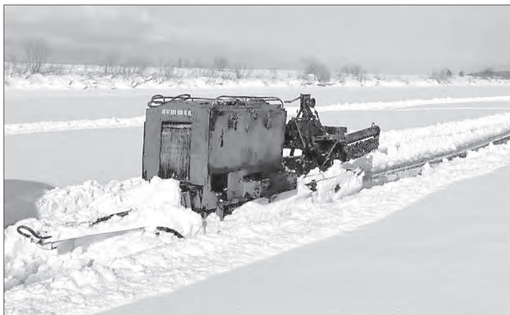
К ледорезным работам приступили на крупных реках Северной Двине и Сухоне

По прогнозам Центра погоды ФОБОС, на этой неделе температура воздуха в регионе поднимется выше нуля. Предстоящее потепление ускорит таяние снега.