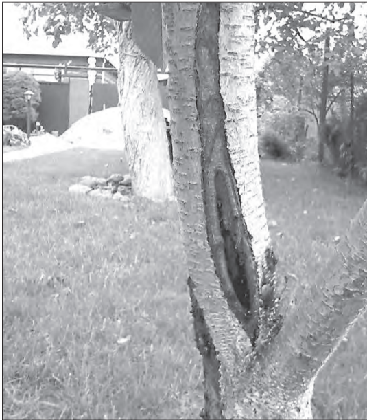
Морозобоина — трещины на стволах деревьев, возникающие в результате резкой смены температур

Как уберечь сад от солнечных ожогов и морозобоин