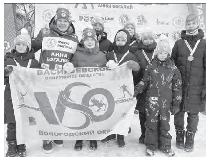
Мы поздравляем наших юных спортсменов, проявивших волю и упорство на соревнованиях!