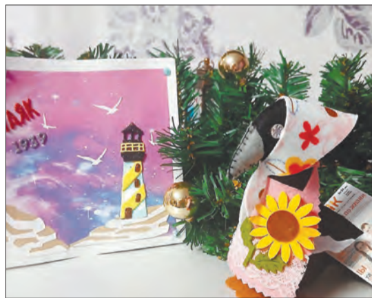
Сорока, несущая на хвосте свежие новости