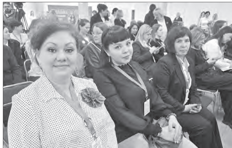
Участницами мероприятия стали и члены Женсовета округа — муниципального отделения Союза женщин России

В этот раз Конференцию женщин-предпринимателей «Деловая весна» посвятили теме развития креативных индустрий и туризма в Вологодской области. Ее почетным гостем впервые стала российская телеведущая и председатель Общероссийской общественно-государственной