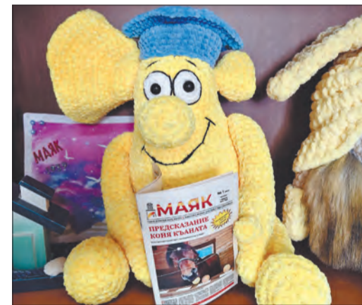
Большой Ух — у него острый слух! Он расскажет новости со всего света

Друзья, вот и подошел к завершению наш конкурс на смотрителя маяка. Он подарил нам россыпь удивительных работ от талантливых детей и взрослых. Мы с интересом рассматривали каждого претендента, восхищаясь мастерством и фантазией участников.