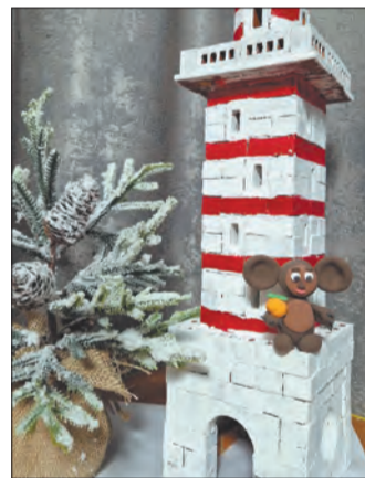
Рукотворный маяк со смотрителем Чебурашкой