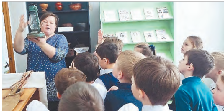
Ученики с большим удовольствием и интересом посещают музейные уроки

Школьный музей, основу которого составила коллекция небольшого музейного уголка, в Перьеве собирали по крупицам. Экспонаты удается собирать не только благодаря местным жителям, ученикам, но и совершенно незнакомым, но неравнодушным людям. Многие замечают: «Если для детей в школьный музей, то с большим удовольствием отдадим даже самые дорогие сердцу вещи. Там сохраннее будет, и пользы от них больше».