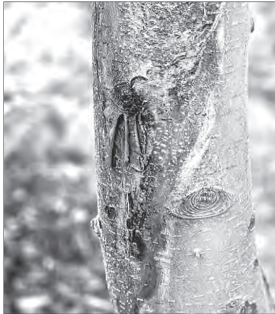
Солнечный ожог проявляется в виде омертвления коры с южной стороны ствола

Казалось бы, зима на исходе, солнце прогревает всё ласковее — самое время радоваться приближению весны. Но для опытного садовода март — один из самых тревожных месяцев. И главный враг наших яблонь, груш и вишен в это время — вовсе не запоздалый мороз, а мы сами, а точнее — наша беспечность.