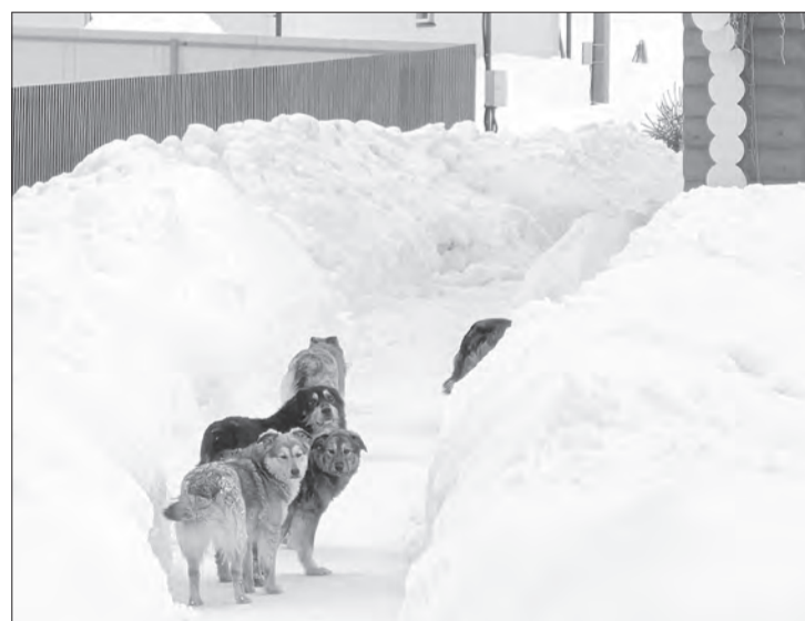
Активисты из Васильевского намерены не только отладить отлов бродячих собак, но и заняться поиском новых хозяев для них

«Параллельно мы будем оставлять заявки в приюты для поиска новых хозяев. Процесс устройства взрослых собак идет непросто, но мы будем стараться», — пишут активные женщины Васильевского.