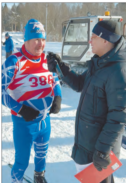
Поздравляем наших атлетов с заслуженным успехом и желаем им крепкого здоровья, новых рекордов и дальнейшего спортивного роста!