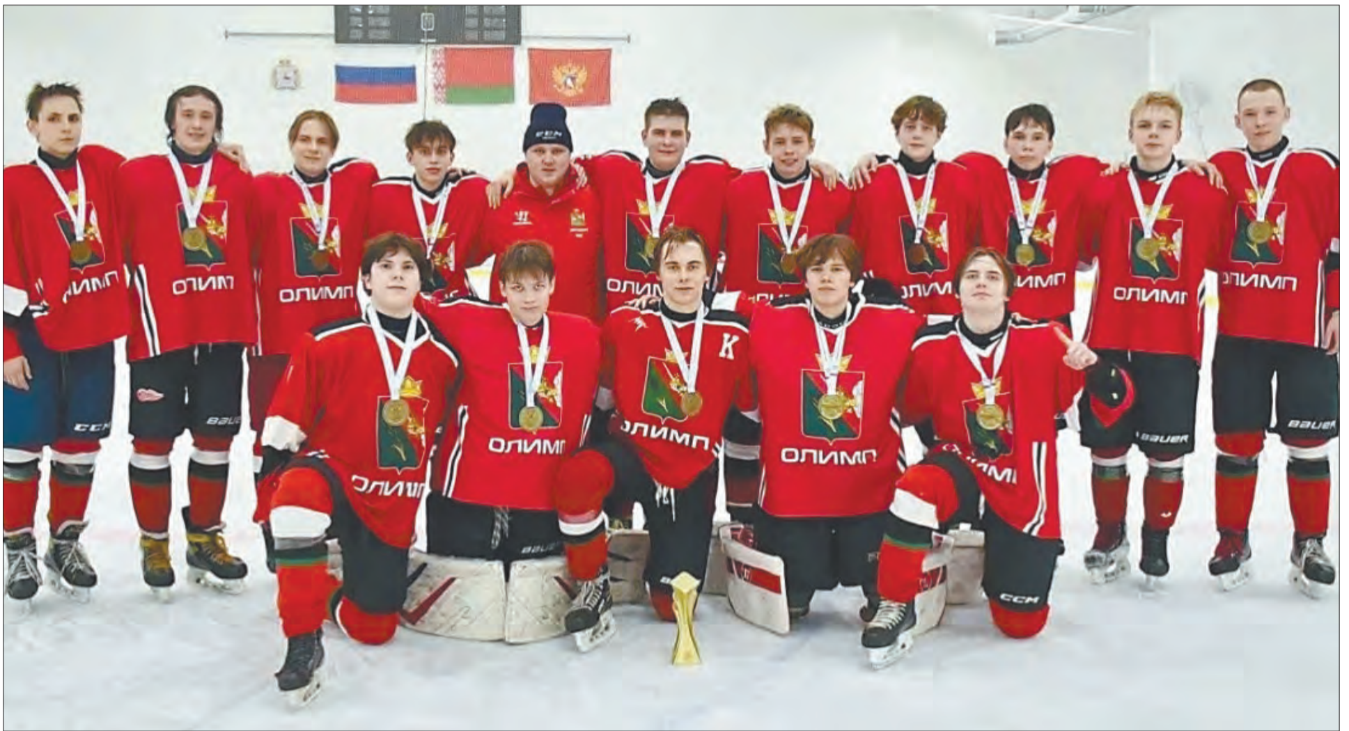
Юные хоккеисты из Майского вышли в суперфинал Всероссийских соревнований «Золотая шайба» и продолжают борьбу за главный трофей