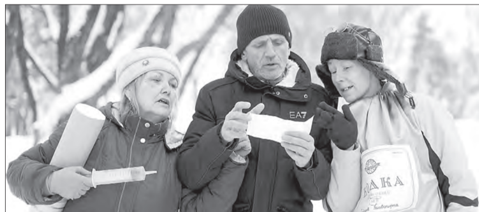
Критика вредных привычек пошла жителям Грибкова на пользу

В День здорового образа жизни две закадычные подружки Бутылка Водки и Сигарета, искусно сыгранные местными жителями, с целью развенчать мифы о полезности спиртного и курения провели среди населения викторину «Правда или ложь?», да ещё и памятку каждому в руки выдали, чтобы надолго запомнил об этой встрече.