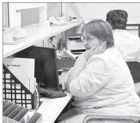
Помимо поликлинического звена, Кубенская участковая больница обеспечивает работу круглосуточного и дневного стационаров, а также отделения скорой помощи

1. ИНФОХОЛЛ. Здесь появятся декоративные стеллажи-окна с резными наличниками. В зоне отдыха установят