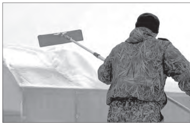
Своевременная очистка — единственный способ избежать деформации каркаса теплицы или полного его обрушения