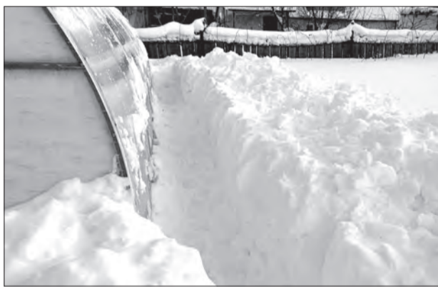
Важно убирать снег не только с крыши, но и от стенок теплицы