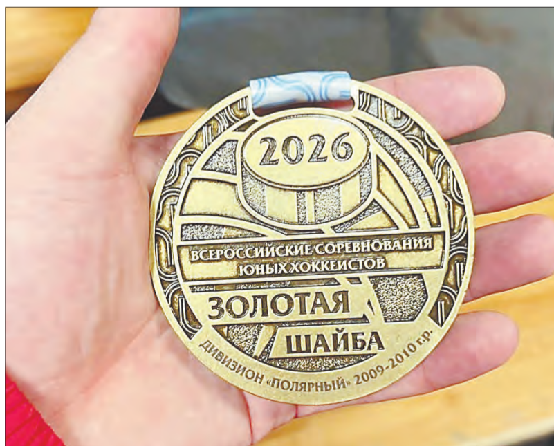
«Золотая шайба» — один из старейших турниров в России, он помогает юным хоккеистам двигаться к своей мечте

Путь к золоту был непростым — каждый матч превращался в серьёзное испытание, но упорство и мастерство помогли ребятам преодолеть все преграды.