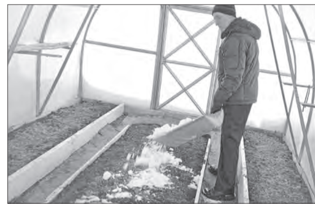
Снег внутри теплицы естественным образом увлажнит и подкормит почву