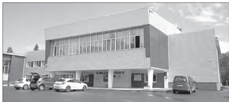
Капремонт здания Дома офицеров в поселке был завершен в 2019 году