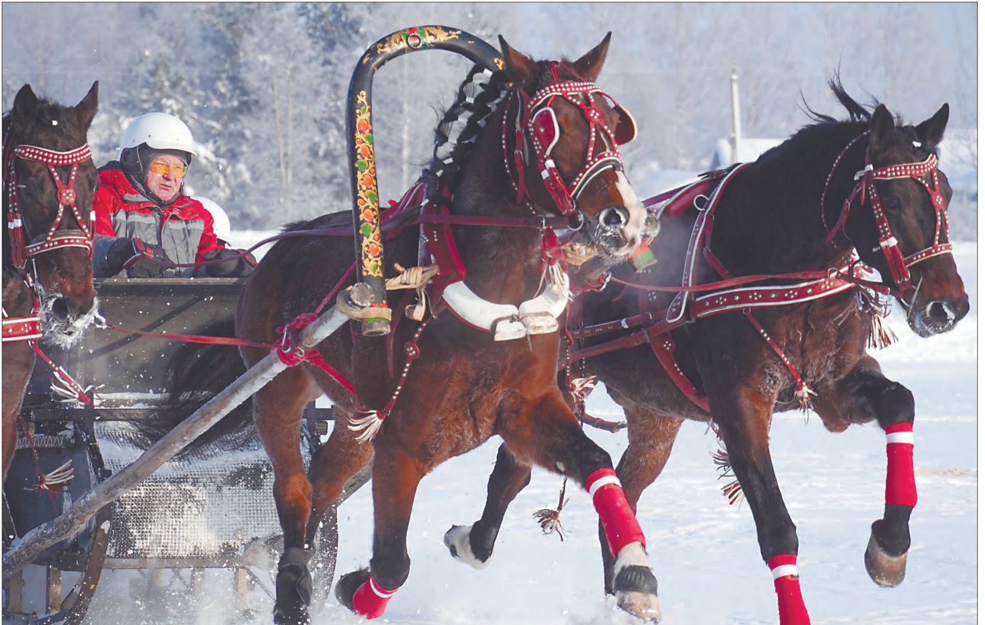
Чтобы управлять «птицей-тройкой», надо обладать горячим сердцем и холодной головой, считают опытные наездники