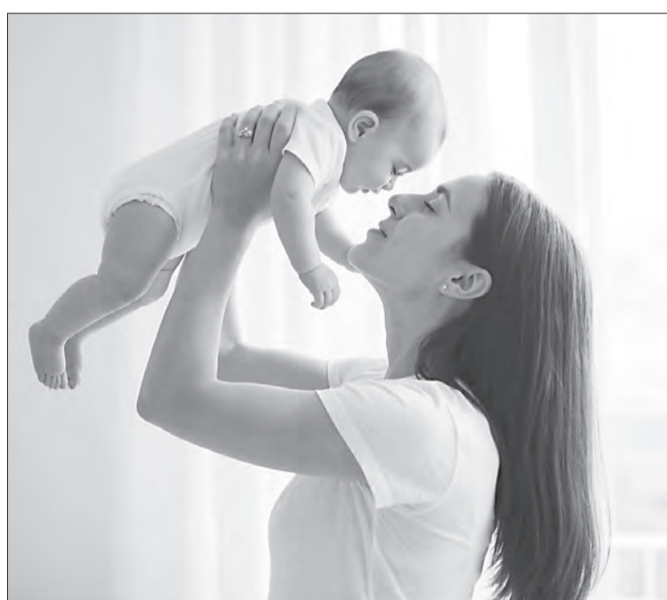
Новая выплата в 100 000 рублей за первенца — это весомый вклад в будущее молодых вологодских семей

Чтобы воспользоваться правом на выплату, необходимо соответствовать нескольким критериям. Ребенок должен