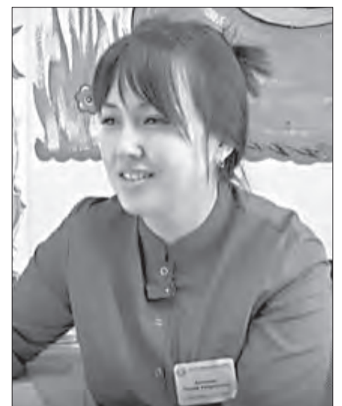
Жители Федотова дружелюбно приняли молодого специалиста из Башкирии