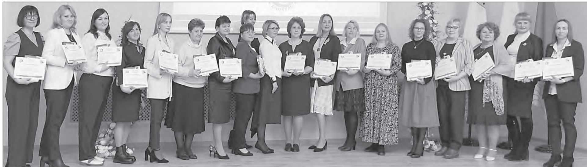
В торжественной обстановке отметили педагогов-наставников, ведь от работы каждого учителя зависит будущее нашей страны

Десятки педагогов Вологодского округа покорили «Педагогический олимп-2025/26»