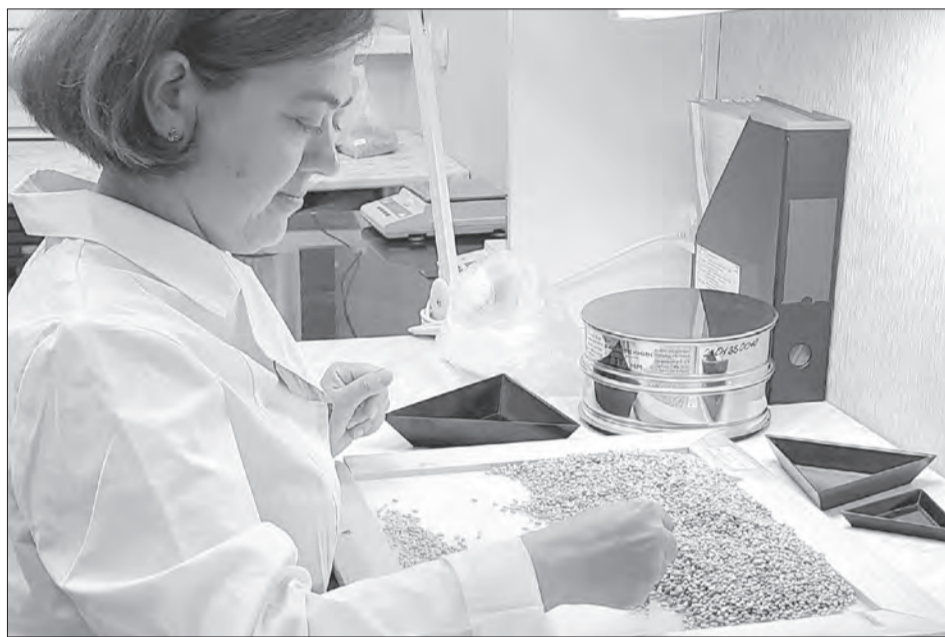
Отбор проб семян с 1 января 2026 года осуществляют аккредитованные специалисты

«Новый ГОСТ соответствует современным реалиям. Ну и, безусловно, повышает качество отбора проб, что позволяет сделать анализ более профессиональным. Если раньше пробы семян для проведения анализа к нам привозили сразу с предприятий, то теперь наши специалисты по графику выезжают в хозяйства и проводят отбор проб в хранилищах, — комментирует «Маяку»