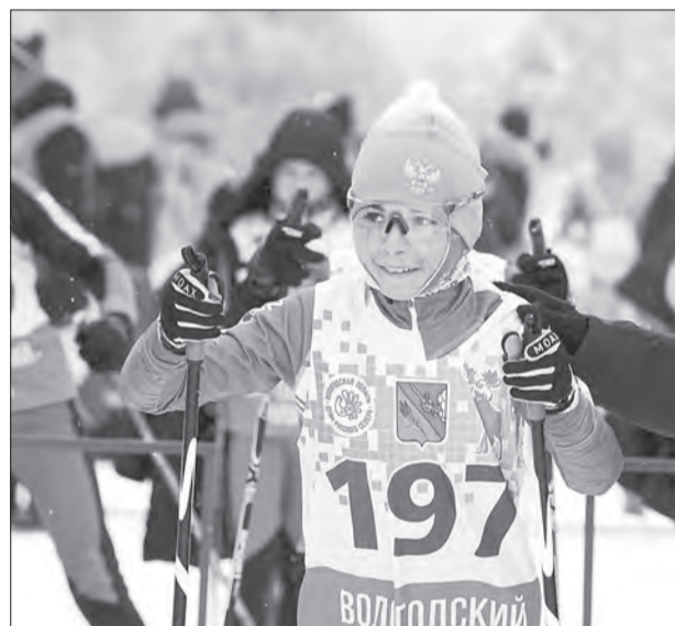
Команда Вологодского округа показала достойный уровень подготовки, слаженность и волю к победе

Областной этап Всероссийских соревнований по лыжным гонкам среди школьников «Пионерская правда» прошел в Васильевском в минувшие выходные.