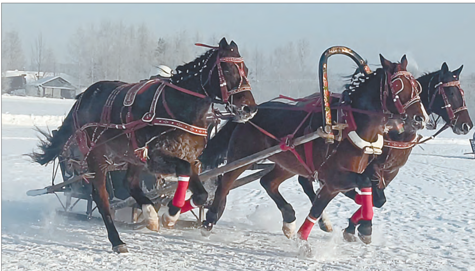
Кони летели и парили, завораживая многочисленных зрителей своей невероятной статью и прытью

«В этом году всё сложилось как нельзя лучше, — поделился впе-