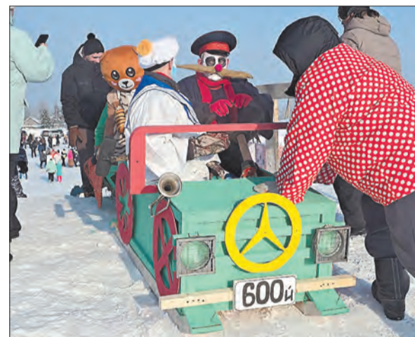
Победители конкурса драндулетов

Семь команд, семь безумных идей и одна цель — войти в историю, желательно не развалившись на старте. Жюри оценивало не только скорость, но и стиль, устойчивость и просто волю к жизни каждой конструкции.