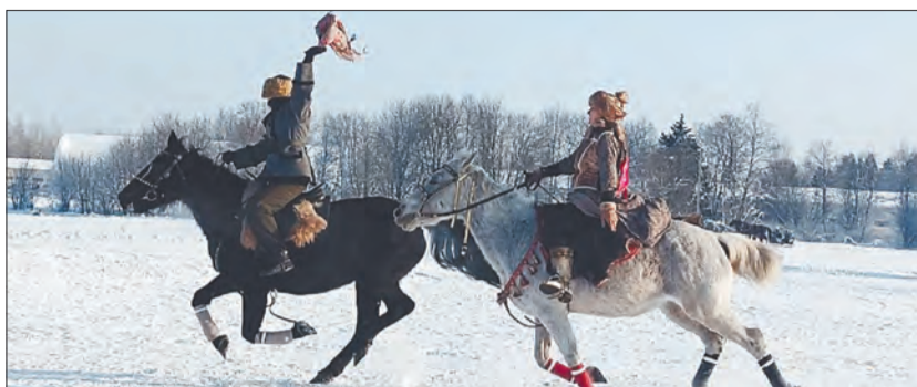
Заворожили зрителя и выступления конников в реконструкции исторических событий. Традиции соревнований всадников за поцелуй девушки заставили заглянуть на несколько веков назад

когда-нибудь воочию увидеть эти соревнования.