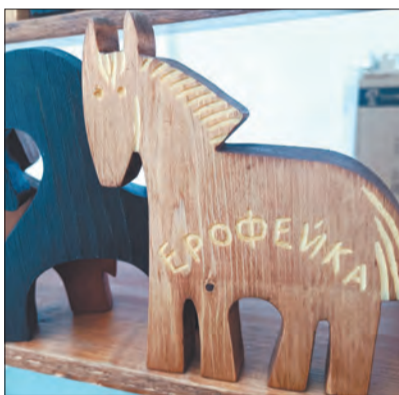
Ремесленники подготовили для гостей на память многочисленные сувениры