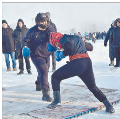
Нешуточные бои разворачивались на интерактивных площадках