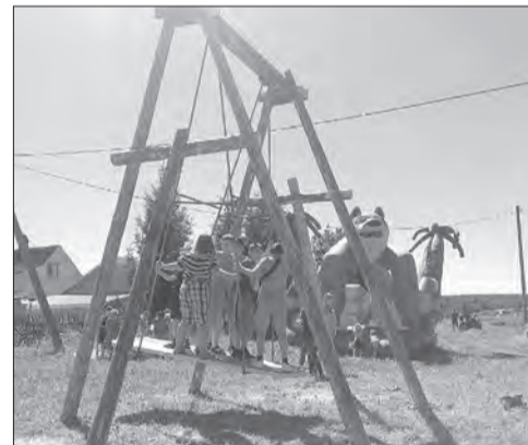
Качели — развлечение для нескольких поколений