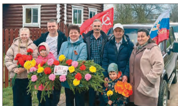
9 мая по традиции жители деревень возлагают цветы к обелиску