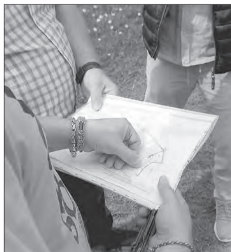
В Неверовском требуется помощь в обустройстве уличных проездов

селе создать комфортные условия проживания. Тут дорогу за свой счет отсыпали, тут договорились с собственниками о перемежевании, которые мешают обще-