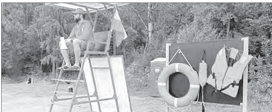
Предполагается, что смотреть за порядком на пляже будут спасатели

«В планах добавить песка, потому что дожди его частично вымыли. В прошлом году завезли около 250 тонн песка, в этом году завезём примерно столько же. Уже провели акарицидную обработку территории, на следующей неделе покосим траву, которая уже подросла и мешает. Заход в воду плавный, поэтому удобно купаться и детям — для них оборудована зона купания, отделенная буйками, за которые нельзя заплывать.