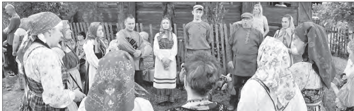
Гулянья проходят в Голубкове дружно, и в хороводе люди становятся ближе друг к другу

В Голубкове теперь частенько затевают народные забавы, например, чемпионат деревни по старинным русским видам спорта. Также делали «Стог свиданий». Установлены гигантские качели с платформой, способной вместить несколько человек. На юбилейный День деревни пригласили даже артистов из Москвы — ансамбль «Народный праздник».