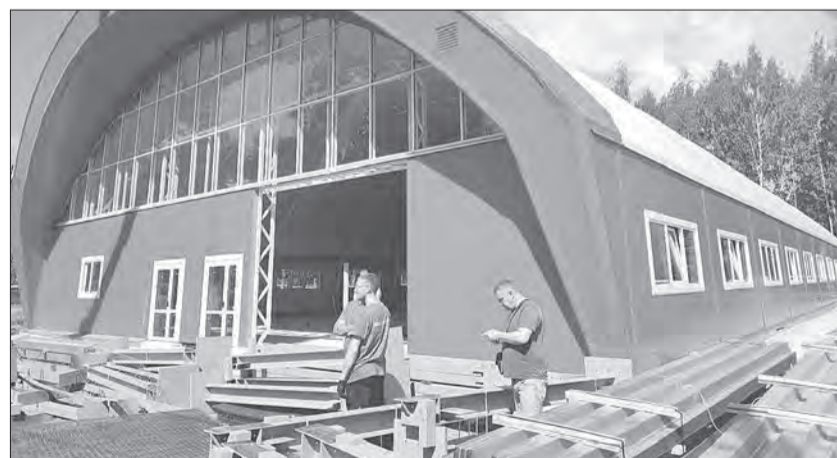
Проект по возведению модульного ФОКа был инициирован местными жителями

К первому сентября красота будет не только снаружи, но и внутри.