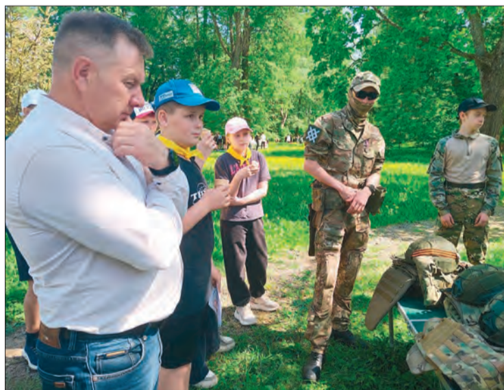
Новая форма фестиваля в виде практических занятий помогает ребятам лучше запомнить правила безопасности

Рота «Боевого братства» продемонстрировала современную военную экипировку и настоящие автоматы. Оружие можно было потрогать, бронезилет и каску — примерить, а потом в 18-килограммовом снаряжении с автоматом в руках сделать пять