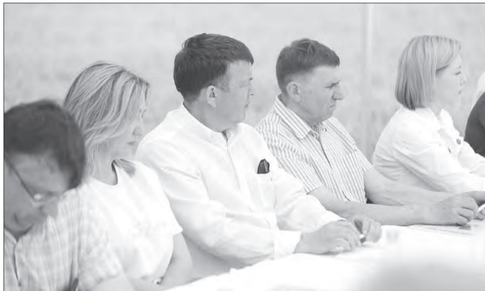
Аграрии Вологодского округа приняли участие в заседании Совета по развитию сельского хозяйства

На данный момент посевные площади Вологодчины готовы на 62,7% от плана — посеяно 76 тысяч гектаров. В целом яровой сев сельхозкультур в 2025 году — 121,1 тысячи гектаров, в том числе 86,4 тысячи гектаров — яровые зерновые, 27,2 тысячи гектаров — кормовые культуры, 2,5 тысячи гектаров — рапс, 1,8 тысячи гектаров — лен и 3,2 тысячи гектаров — картофель и овощи.