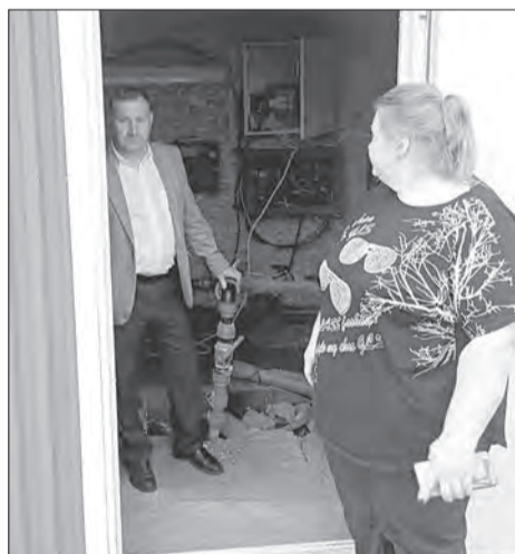
В Марфине решилась проблема водоснабжения