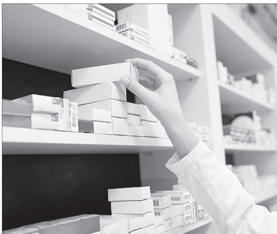
За аптечной деятельностью вводится жесткий государственный контроль

«Лекарственные препараты относятся к особой категории товаров, от качества и доступности которых напрямую зависят здоровье и жизнь людей. Их оборот требует особого контроля и надзора со стороны государства, — прокомментировал «Маяку» новшество заместитель министра здравоохранения области