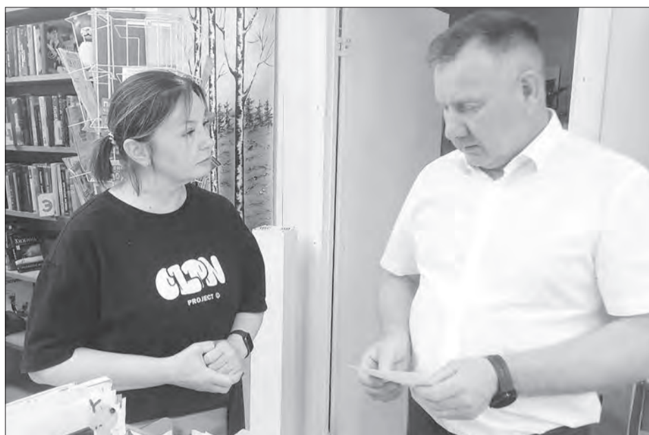
В Грибкове особого внимания требует библиотека. Сейчас она размещается в непригодном помещении

Местные активисты не сидят сложа руки и тратят много сил на то, чтобы в