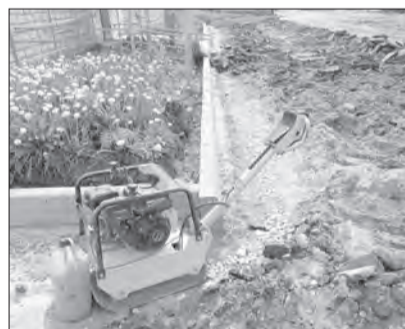
На центральной площади в Огаркове заменят асфальтовое покрытие

Это один из самых масштабных проектов благоустройства этого года в округе. Его реализация стала возможной благодаря участию муниципалитета в национальном проекте «Инфраструктура для жизни».