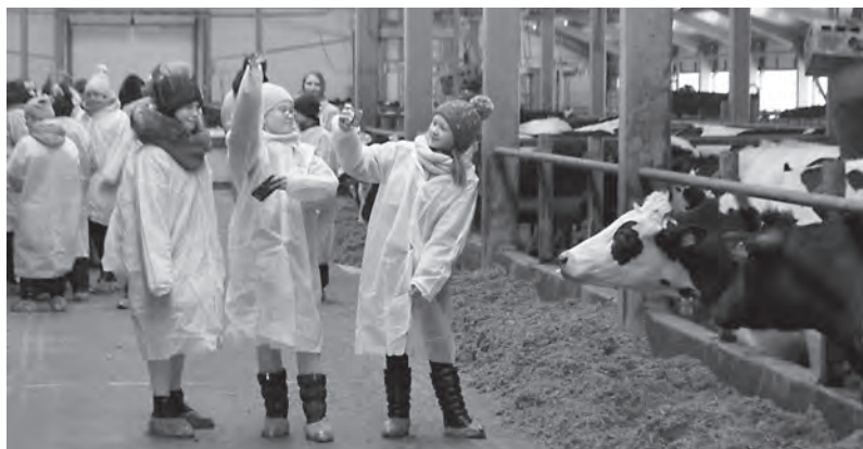
Ранняя профориентация широко практикуется в Вологодском округе. Так, в 2018 году Огарковская школа стала федеральной инновационной площадкой в сфере агробизнес-образования. А в Перьевской школе в 2022 году был первый выпуск по профилю «Лесная охрана»

Классы оснастят оборудованием, которое используется в сельском и лесном хозяйстве. Благодаря проекту школьники будут