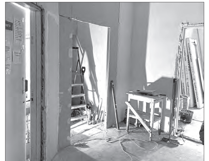
В помещениях предстоит провести полное обновление — от проводки и «косметики» до мебели и установки пандуса

Здесь оказывают помощь трем тысячам жителей самого Кувшинова и деревень Михальцево, Подберевское и Чашниково. Из них 2,5 тысячи взрослых и около 500 детей.