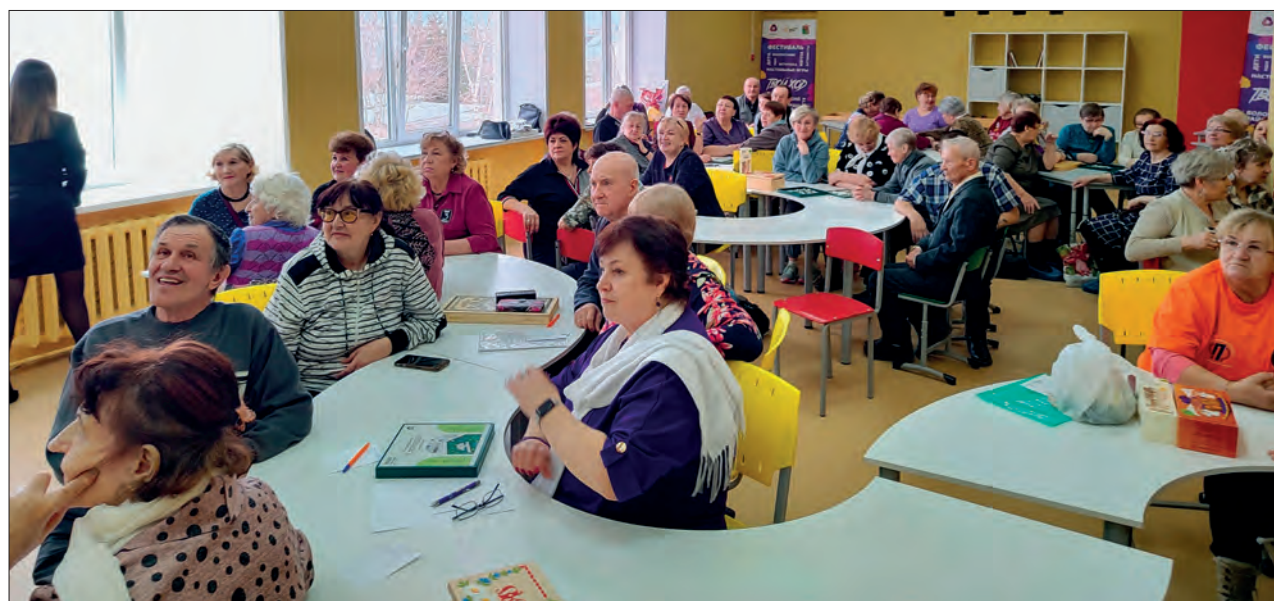
В планах у ветеранов округа провести турнир по настольным играм с командой из Вологды

Самых активных, веселых, неугомонных и отзывчивых людей округа принимала 26 марта в своих стенах Спасская школа