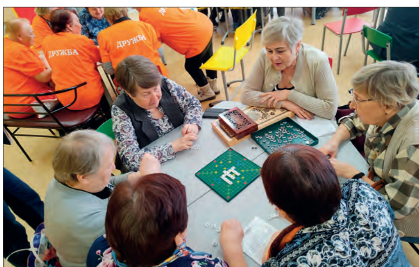
Современная игра «Словодел» оказалась знакомым с советских времен «Эрудитом», в которую многие из участников играли еще со своими детьми

«Мы каждую неделю собираемся, играем в шашки, «Словодел» начали изучать, в нарды у нас играет только один член команды, только неделю как научилась в них играть. Мы устраивали на прошлой неделе дружескую встречу по настольным играм с детьми, третьеклассниками из Васильевской школы. Поиграли в шахматы и шашки. Они очень хорошо играют, серьезные такие. Надеемся, что еще с ними встретимся», — рассказывают представители