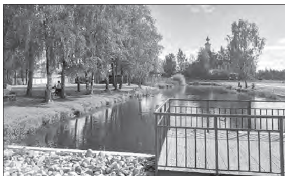
В Кубенском в этом году завершат благоустройство общественного пространства в центре села. Средства выделены по федеральной программе «Формирование комфортной городской среды»

Всего в 2024 году в области в рамках проекта «ФКГС» планируется благоустроить 229 объектов, в том числе 178 дворовых и 49 общественных территорий, а также два проекта-победителя Всероссийского конкурса лучших проектов создания