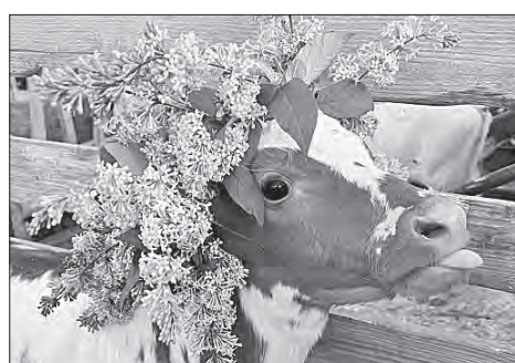
Вот таких очаровательных нетелей продает племзавод «Майский» через электронный сервис «Сделано на Вологодчине»