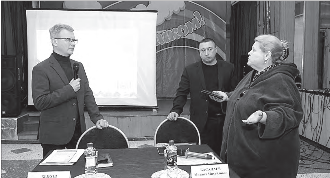
Встреча с жителями села Куркино прошла эмоционально, но эффективно. Многие вопросы, в частности, касающиеся обслуживания жилого фонда, были сразу же взяты в работу