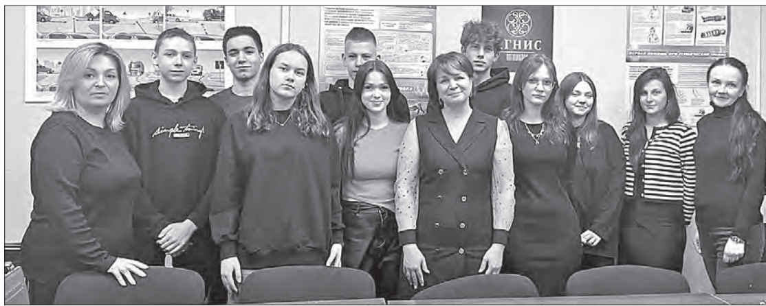
Поддержка семей участников СВО — одно из приоритетных направлений деятельности как регионального правительства, так и муниципальной власти

«Посетили занятие, группа уже практически изучила теоретическую часть, параллельно