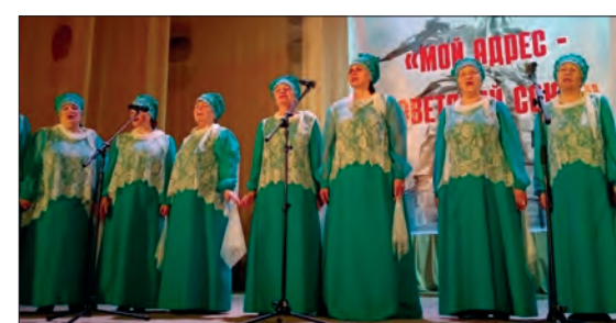
Коллектив женского хора «Родные просторы» из Лесковского ДК стал одним из участников фестиваля

В ностальгическом фестивале приняли участие более 80 артистов из Вологодского, Грязовецкого округов и Вологды. Яркие выступления вокалистов с первых минут пленили зрителей. Зал очень тепло принимал каждого исполнителя, одаривая бурными аплодисментами. Знакомые всем песни советской эстрады и кинопесни зал пел вместе с выступающими.