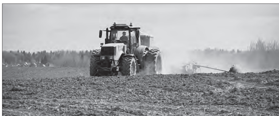
В целом предприятия округа прошлой осенью засыпали почти 10 тысяч тонн семян, что на 40% больше потребности. Что касается подкормки, всего хозяйства планируют закупить 13 тысяч тонн минеральных удобрений

«Китайской техникой мы «наелись»: ненадежная, себя не зарекомендовала. Новая машина должна работать три года без проблем, а тут поломок много. Западная техника дорогая — есть машины стоимостью по 20-30 миллионов рублей. А если что-то сломается, транспортер или редуктор полетит, в посевной заминка на месяц или два? С годами будет всё только хуже, думаю, надо постепенно переходить на российское», — считает