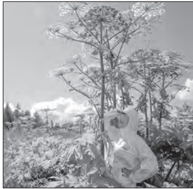
Борщевик неконтролируемо распространяется и очень опасен для человека, особенно летом — в период цветения

Для комплексной работы необходимо подключать владельцев сельхозугодий и частных земельных участков, привлекать дорожные службы к обработке придорожных канав, газопроводов и энергетиков для расчистки от борщевика просек газопроводов