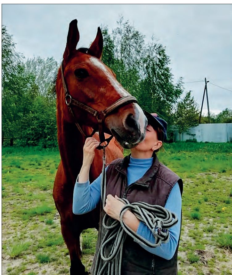
У каждой лошади свой характер. На протяжении жизни он если и меняется, то в лучшую сторону, отмечает заводчик

«Разводим такие породы, как голландская теплокровная», ольденбургская, ганноверская. Они более подходят для спорта, потому и спрос на них велик — в Москву, Санкт-Петербург, Самару. Выступают за Россию, то и дело новости про наших лошадей узнаем, кто-то в конкуре, кто-то в выездке себя проявил. Недавно мы привезли из Читы чубарых забайкалов на разведение. Кони небольшого роста и необычного окраса: на белом фоне черные или коричневые пятнышки, как королевская мантия. Сначала обрастали шерстью, как мамонты приехали,